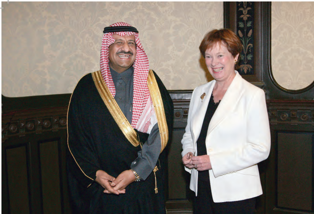
Vice försvarsminister från Saudiarabien, prins Khaled, och Sveriges dåvarande försvarsminister Leni Björklund (S) möter pressen i samband med statsbesöket i november 2005. Det avtal som då slöts förnyades sedan av den borgerliga alliansregeringen.