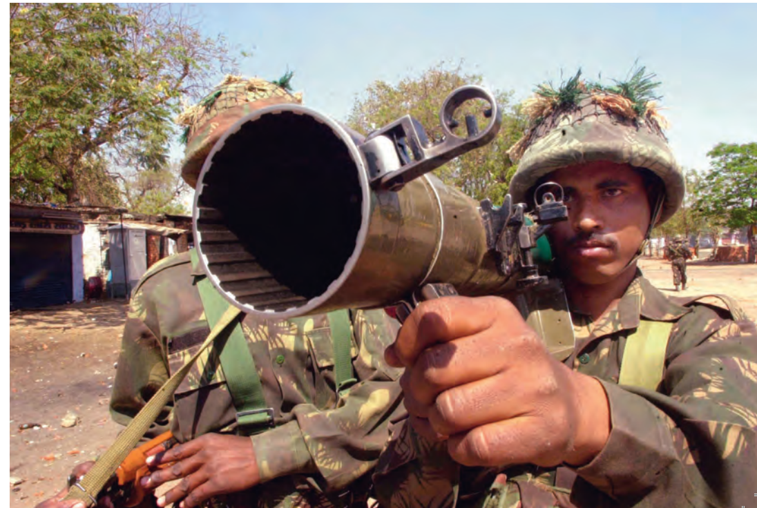
Indisk soldat med det svensktillverkade granatgeväret Carl Gustaf i samband med våldsamma oroligheter i Ahmadabad 2002.

Luftvärnsroboten Robot 70 finns idag i minst 18 länder, till exempel Argentina, Bahrain, Brasilien, Förenade Arabemiraten, Indonesien, Iran, Pakistan, Singapore och Tunisien. 1999 användes Robot 70 i Kargilkriget i Kashmir.