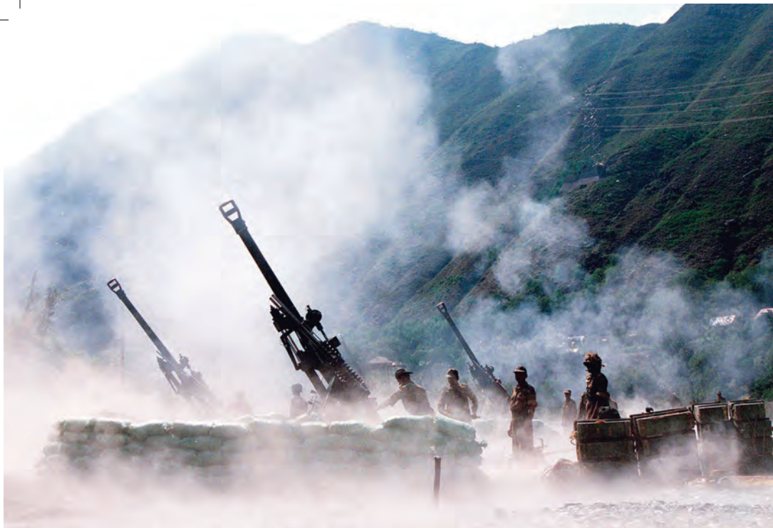
Indiska armén använde Boforstillverkade 155 mm kanoner i Kargilkriget i Kashmir 1999.