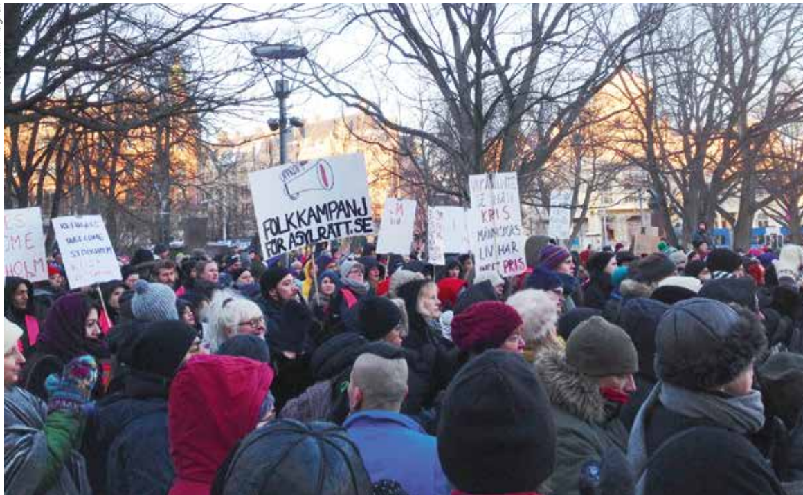
Den 16 januari var Folkkampanj för Asylrätt med på Tillsammansskapets manifestation för rätten att söka asyl utan förföljelse, där cirka 600 personer deltog.