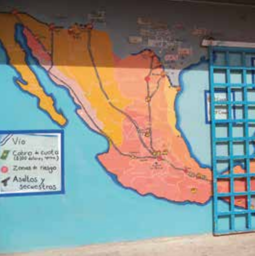
Kartan visar Mexiko och de tåggräns som går genom landet, plus riskzoner där det är störst risk för rån och överfall.