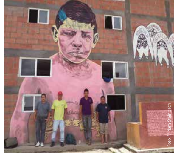
De fyra killarna är centralamerikanska flyktingar som nyligen hade tagit sig över gränsen från Guatemala, med USA som mål.