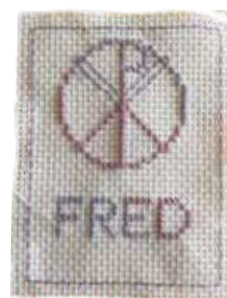
Broderier från kreativa medlemmar under årsmötet.