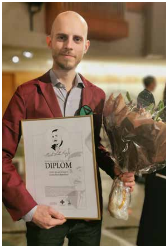
Extinction Rebellion Sverige mottog pris den 20 januari i Nормalmalskyrkan i Stockholm