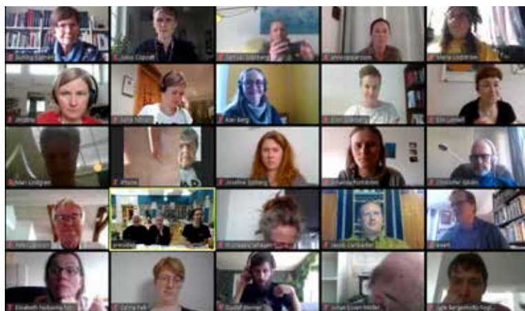
Kristna Fredsrörelsens första digitala årsmöte.

Kanslipersonalen har uppmanats att arbeta hemifrån i största möjliga utsträckning sedan mitten av mars vilket har resulterat i ett myller av tillfälliga fredskontor runt om i Stockholmsområdet.