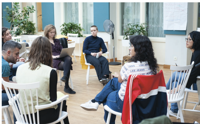
Sista samlingen innan avresa.