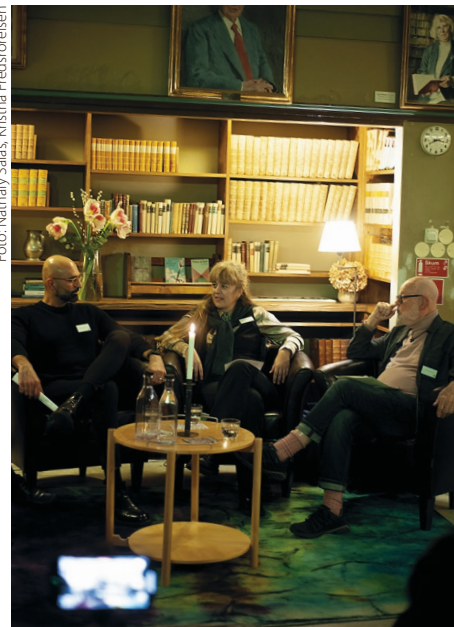
Det öppna kvällsprogrammet ägde rum i Sigtuna-stiftelsens bibliotek.