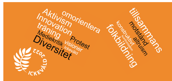
Ordmoln Ickevåld 2022

Det blev tydligt hur viktigt det är att få träffas och hämta kraft hos varandra och i det gemensamma engagemanget för fred och rättvisa. Samtalen gick högt och lågt och återkommande teman var