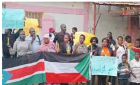
ONAD. Solidaritetsmanifestation utanför Sudans ambassad i Juba april 2023.