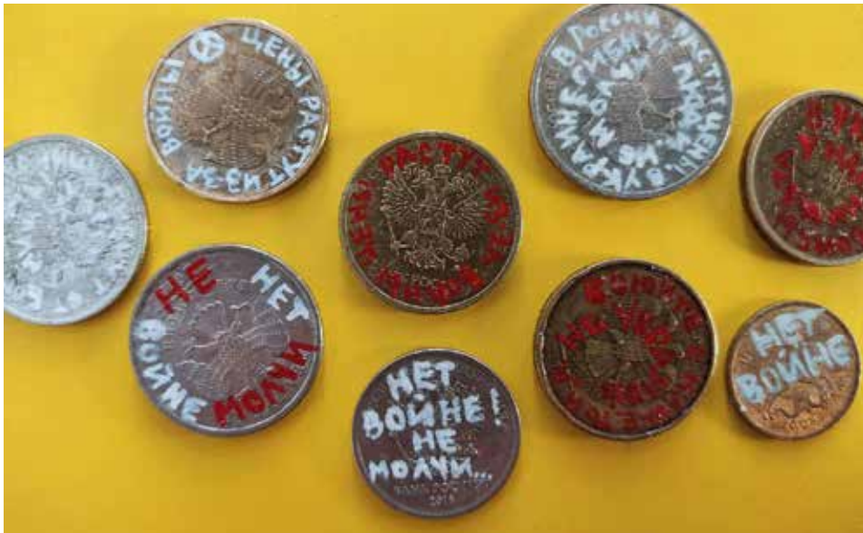
"Ned med vapnen!" - ett sätt att visa motstånd i Ryssland idag är att sprida anti-krigsbudskap via mynt och sedlar.