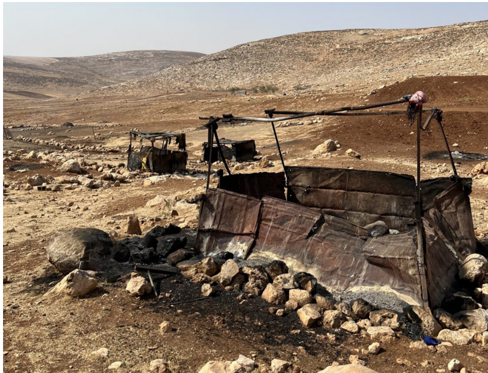
"Vi rörde oss bland brända tältdukar som hängde som trasor på sina tältpinnar efter att ha tänts på av bosättare."

– Jag och mina kollegor sov antingen i vardagsrummet eller på madrasser på taket. Västerut syntes Jordanien, runtom oss fanns dadelpalmer och gator fulla av liv. I gryningen gick en rosa sol upp och vi kunde se klostret