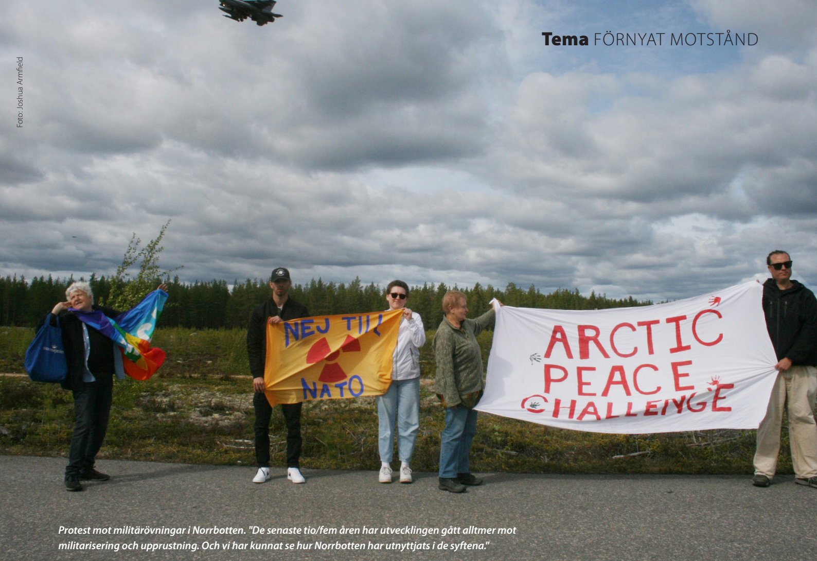
Protest mot militärovnningar i Norrbotten. "De senaste tio/fem åren har utvecklingen gått alltmer mot militarisering och upprustning. Och vi har kunnat se hur Norrbotten har utnyttjats i de syftena."