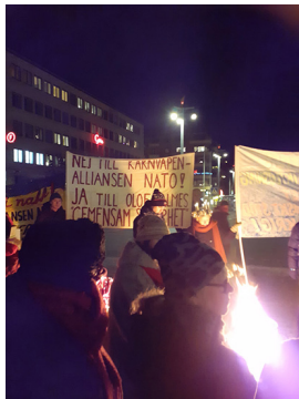
Fredsams årliga fackeltåg 2022.