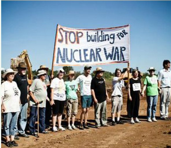
Demonstration i Kansas, USA. Catholic Worker-rörelsen har rötterna i anarkismen. Du måste inte ha officiellt tilldelad makt för att förändra. Det är våra enskilda handlingar som får verkliga politiska konsekvenser.

aktivistgrupp: ”Nato ut ur Norrbotten”, som delade ut flygblad. Jag protesterade mot Nato i USA, men hade inte kunnat föreställa mig att det aktuellt också i Sverige. Så började vårt fredsengagemang här i Luleå.