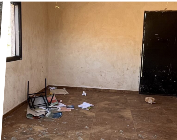
Den vandaliserade skolan i Ras-al-Tin - en av flera byar som tömts på invånare i Västbanken under 2023.