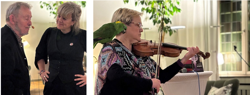
På boksläppet diskuterades bland annat hur ett framtida svenskt Nato-medlemskap kan komma att inverka på Sveriges hållning i kärnvapenfrågan.