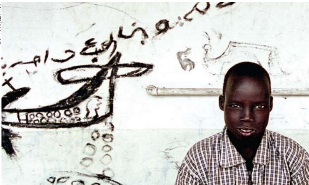
Pojke framför muralmålning av bombplan. Ur rapporten Unpaid Debt.