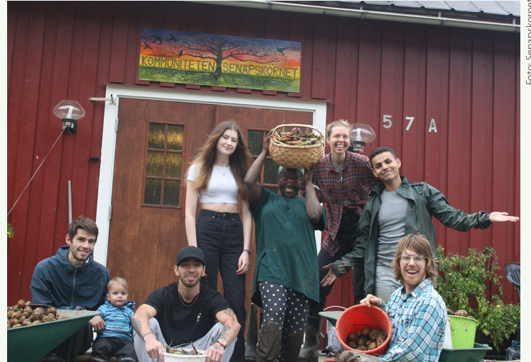
Kommuniteten Senapskornet. "Vad vi längtar efter här på jorden är fler platser att mötas och öva fred på, i stället för övningar i att slåss mot människor som förmodas hota oss."

Catholic Workerrörelsens kommuniteter är olika beroende på kontext. I Luleå samlas vi i motståndet mot Nato. I Kansas protesterade vi mot kärnvapen, för det pågick övningar i närheten.