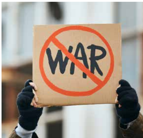
Vapenvägran är en mänsklig rättighet men Försvarsmakten är sparsam med information om möjligheterna att söka vapenfri tjänst.

BAKGRUNDEN TILL situationen är den pågående kraftiga upprustningen av den svenska Försvarsmakten som för med sig ett ökat behov av att informera ungdomar om rätten att vägra vapen. Ett sådant faktamaterial skulle också syfta till att främja reflektion kring de etiska frågeställningar som är förknippade med värn-