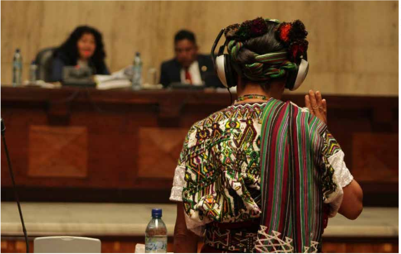
Kvinna från urfolksgruppen maya Ixil vittnade under folkmordsrättegången mot den förra diktatorn Efraín Ríos Montt 2013.