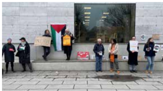
Demonstration i Visby mot kriget i Gaza.