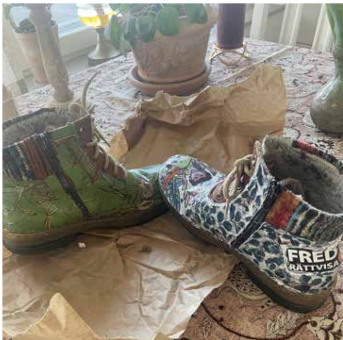
"Pyntade skor blir ett statement och kan användas på liknande sätt som plakat vid demonstrationer och de kan också användas under fredsmarscher."